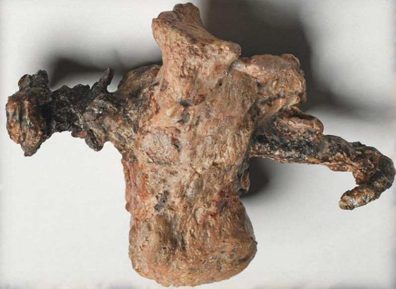
Fersenbein eines Gekreuzigten aus einem Grab in Jerusalem