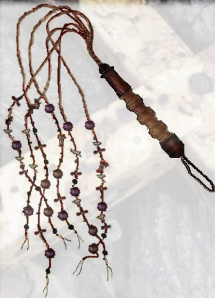
Rekonstruktion eines römischen Flagrum